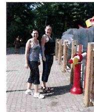
TAKTO JSME DOPADLY, KDYŽ JSME NA VODNÍ BITVU VYZVALY TEENAGERY ☺

Ve čtvrtek 24. 5. 2012 jsme den začali kvízem o městě Amerfoort, kde jsme procházkou získávali odpovědi o zadaných památkách. Dále jsme se autobusem přesunuli k pomníku Napoleona Bonaparte v Austerlitz, vzdálenému zhruba 20 min. od našeho města. Společně s holandskými kamarády jsme se sešli u přírodního jezera HENSCHOTERMEER. Zde jsme strávili pěkné slunečné odpoledne.