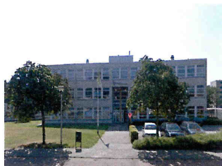
t' Hooghe Landt

V pátek 25. 5. 2012 jsme se všichni sešli v počítačových učebnách a dokončovali jsme své prezentace, které jsme měli už rozpracovány z Čech. Na nedalekém stadionu jsme si zahráli fotbalík a znavení sluníčkem jsme se vydali na poslední nákupy do města. Kolem 17h jsme se všichni sešli ve škole na závěrečném večeru, kam jsme donesli naše výrobky od dortů až po pizzu.