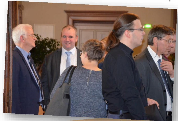
Účastníci kladou otázky