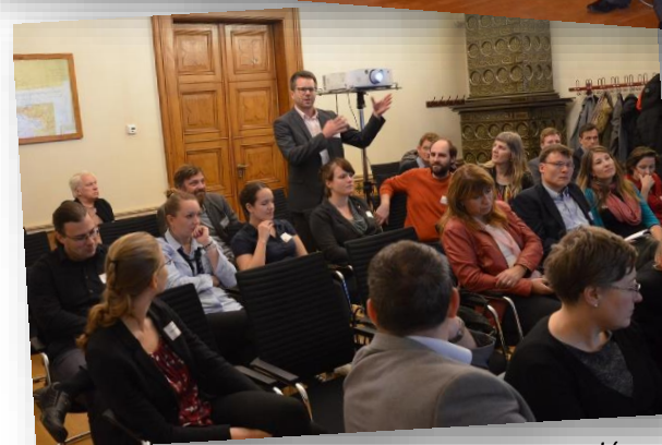
Živá diskuze v plénu, (viz násl. folie)