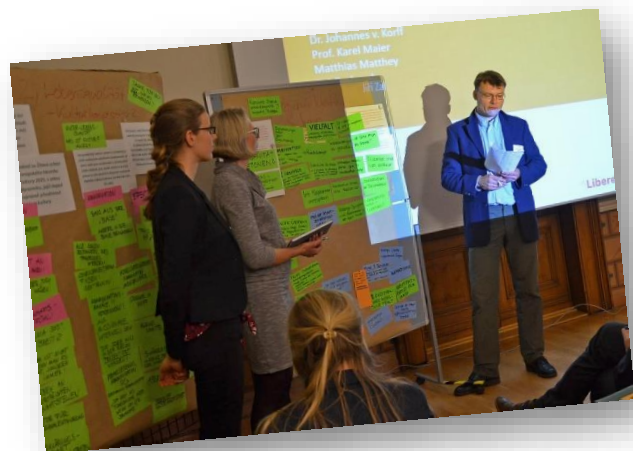
Shrnutí moderátotů k poznatkům z table-sessions.