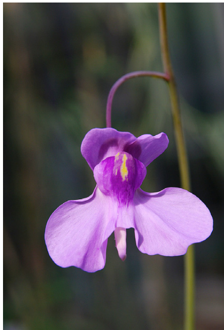
Květy masožravé bublinatky lotosolisté jsou asi 4 cm velké, podobné některým orchidejím.

Umělé navození symbiózy dvou ekologicky velice podivných rostlin, samotných o sobě velice náročných na podmínky prostředí, je potom výsled-