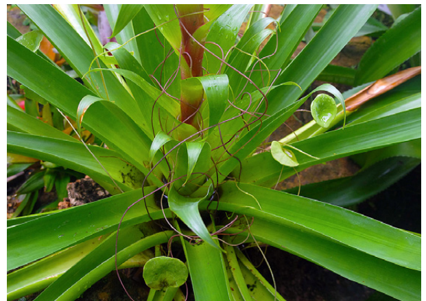
V této růžici bromeliovité rostliny jsou patrné šlahouny a štítovité listy masožravé rostliny bublinatky lotosolisté.