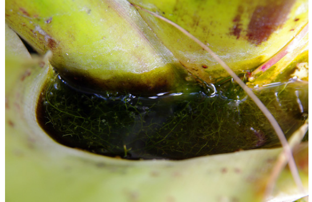
V růžici hostitelské rostliny se drží voda, v níž bublinatka loví plankton. K tomu jí slouží početné lapací měchýřky.

Přijďte se do botanické zahrady podívat. Krom zmíněného pozoruhodného exponátu lze vidět mnohé další, mnohdy stejně skvělé. ●