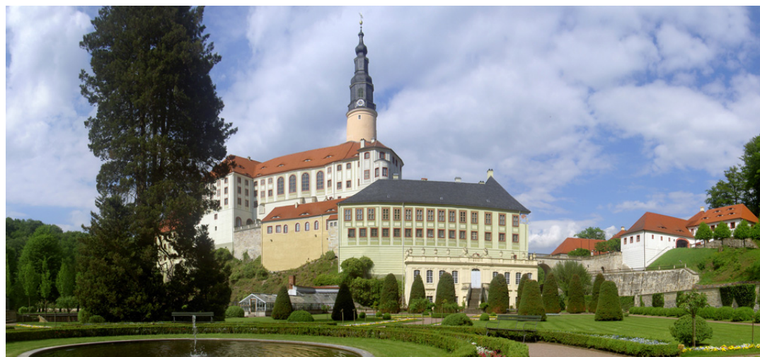
Zámek a hrad Weesenstein nedaleko Pirny je jedním z cílů výletů Liberecké vlastivědy.