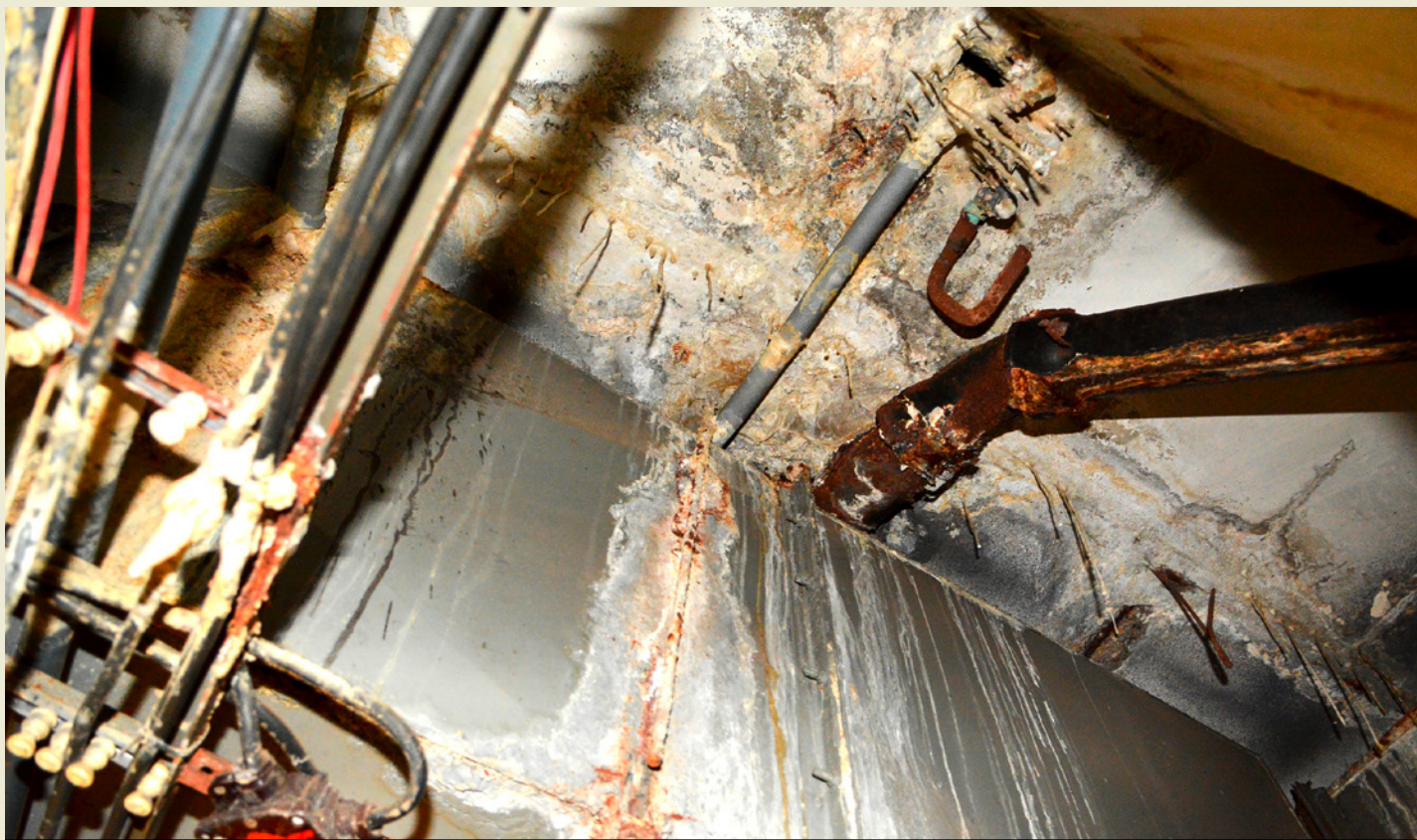
Pohled do zázemí odpadové technologie. Funguje a odpovídá tomu, že bazén aktuálně dokážeme udržet dočasně v provozu, ale i tady už zub času výrazně zařadoval, takže je nevyhnutelné ji co nejdříve nahradit.