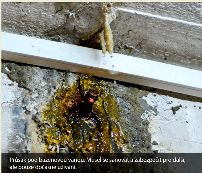
Průsak pod bazénovou vanou. Musel se sanovat a zabezpečit pro další, ale pouze dočasné užívání.