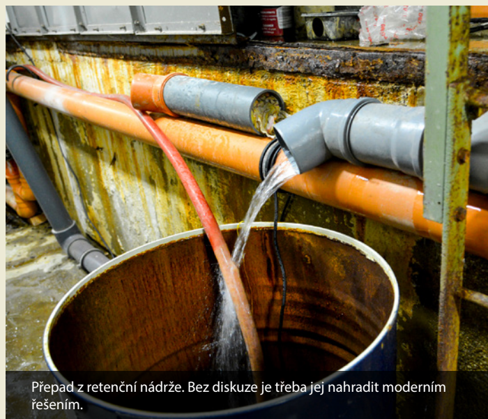
Přepad z retenční nádrže. Bez diskuze je třeba jej nahradit moderním řešením.