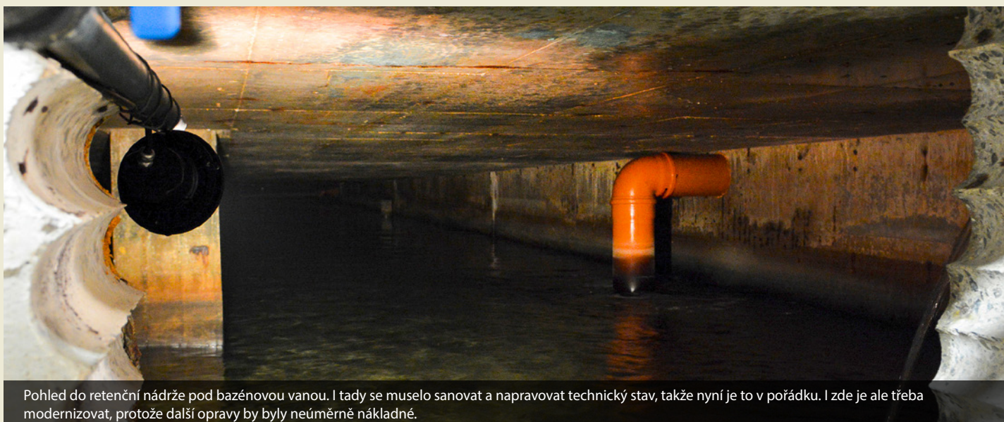
Pohled do retenční nádrže pod bazénovou vanou. I tady se muselo sanovat a napravit technický stav, takže nyní je to v pořádku. I zde je ale třeba modernizovat, protože další opravy by byly neúměrně nákladné.