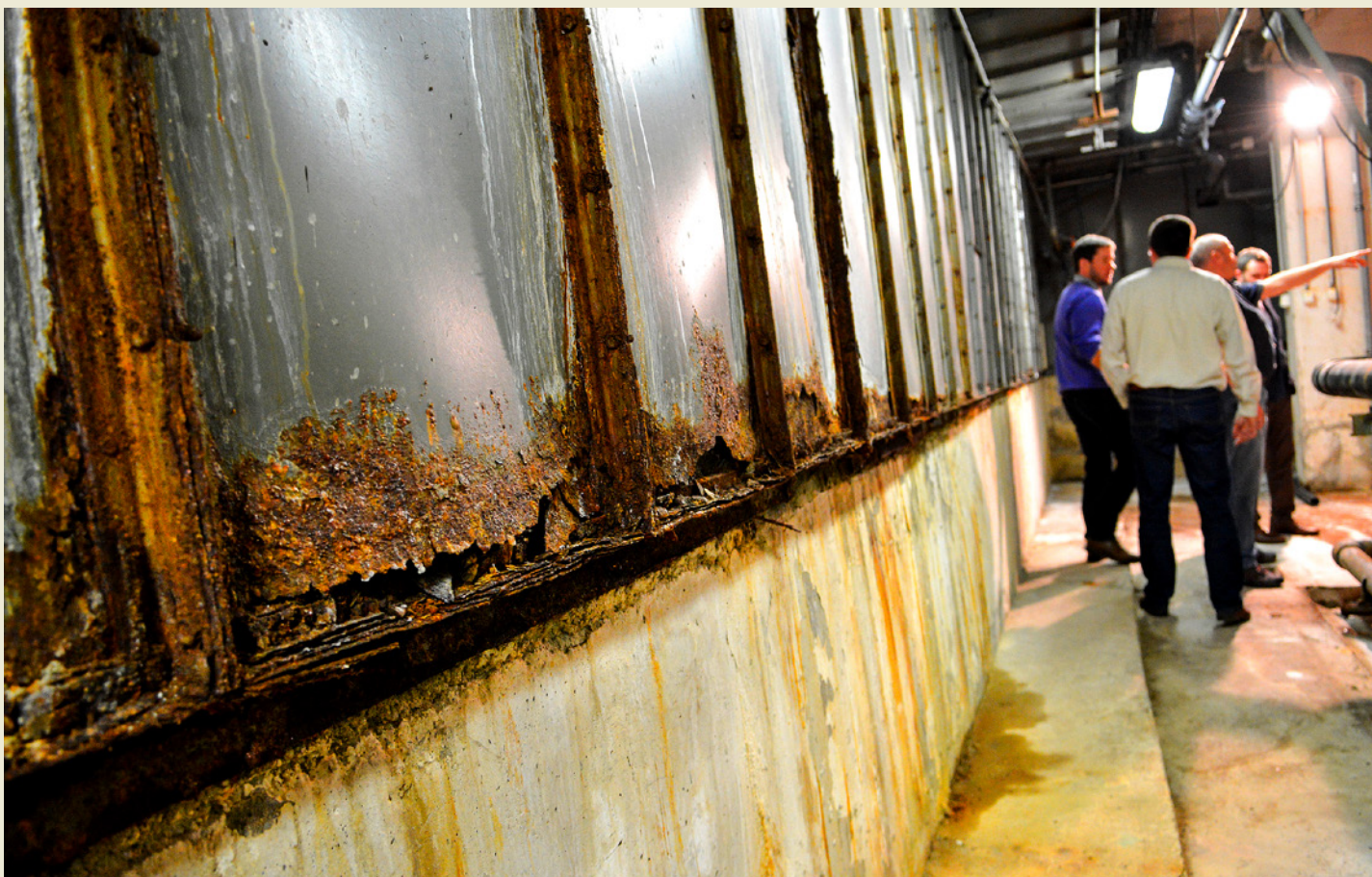
Obložení kolem retenční nádrže, které je třeba nahradit. I tady muselo dojít k náročnému sanování, aby to neohrožovalo běžný provoz bazénu.