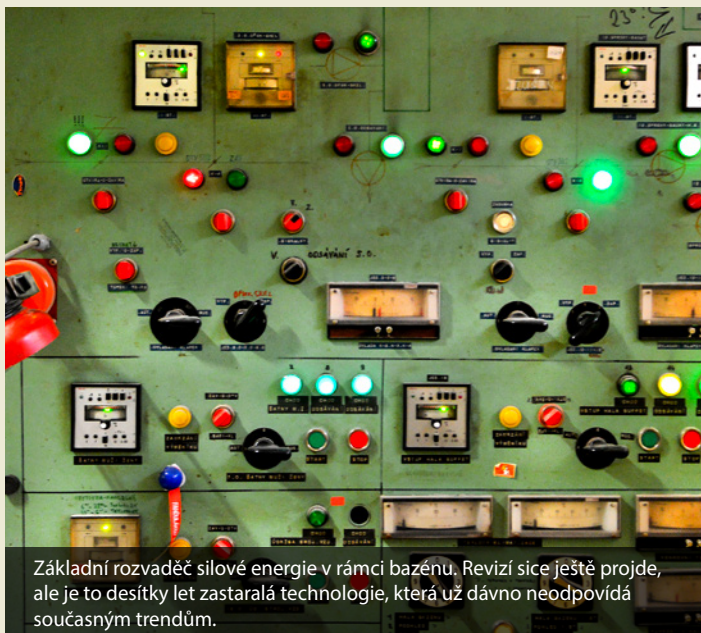
Základní rozvaděč silové energie v rámci bazénu. Revizí sice ještě projde, ale je to desítky let zastaralá technologie, která už dávno neodpovídá současným trendům.